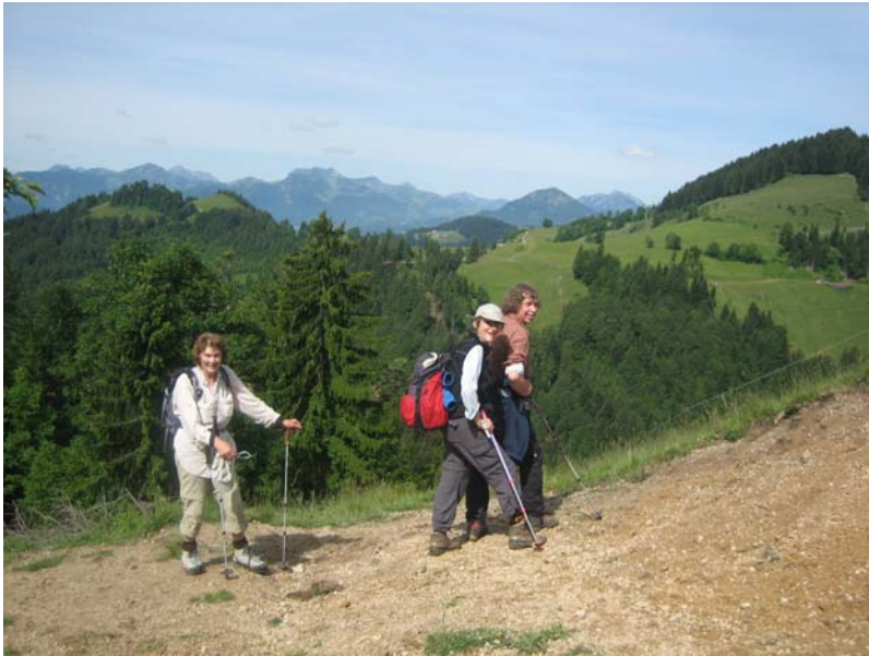
Brennkopf, Chiemgauer Alpen, im Mai, beim Aufstieg