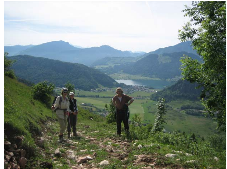
Brennkopf, Blick über den Walchsee