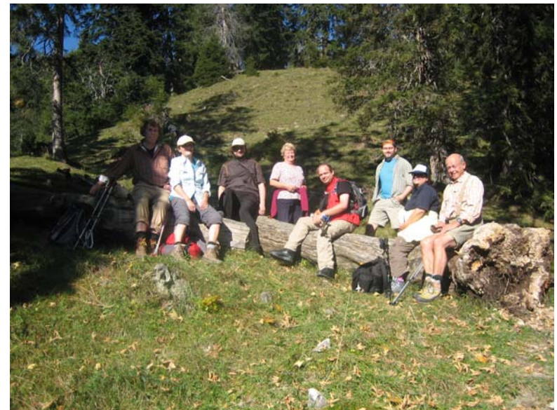
Dürrenberg, Tourteilnehmer auf einem Stamm in der Oktobersonne