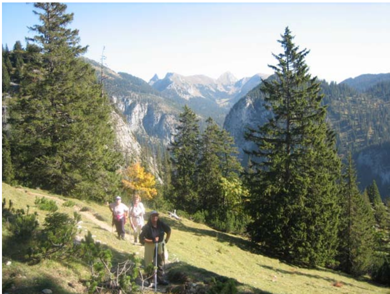
Dürrenberg, Ammergauer Alpen, im Oktober, Aufstiegsausblick